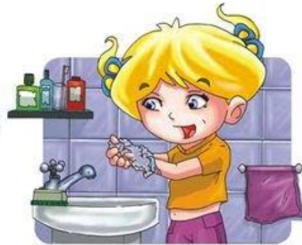
Me lavo las manos frecuentemente.