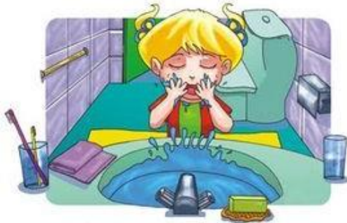
Me lavo la cara todas las mañanas.