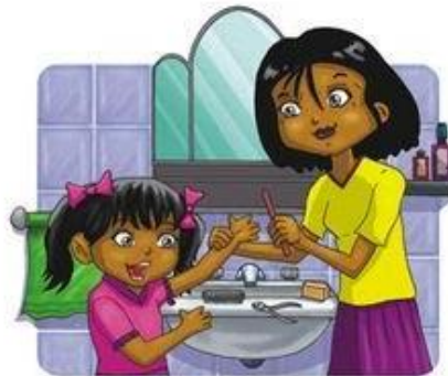
Mantengo las uñas cortas y limpias.