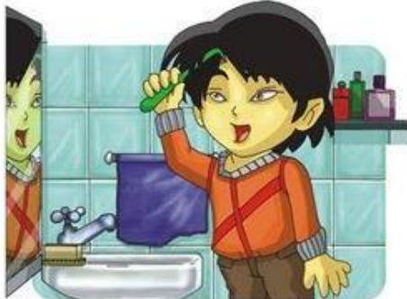
Me peino y mantengo limpio mi pelo.