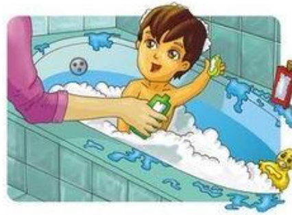
Me baño todos los días.