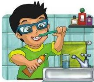
Me cepillo los dientes después de cada comida.